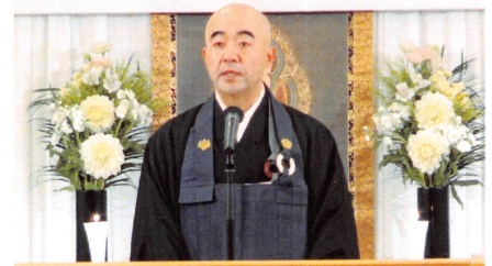
〈大会実行委員長挨拶〉