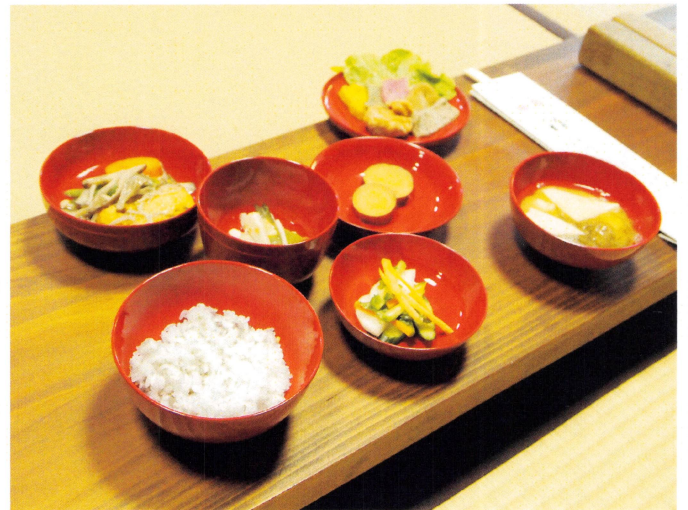
<喜心 老心 大心> 典座係が心を込めて作る精進料理