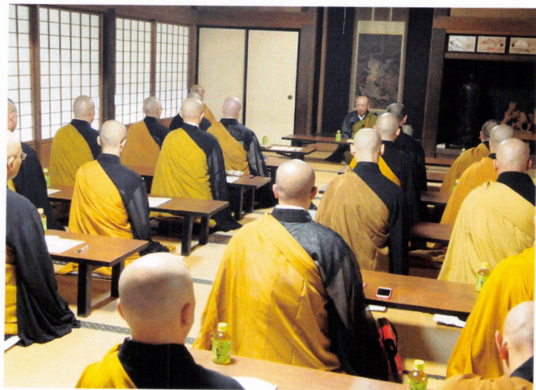
〈老師の一言一句が胸に響く〉