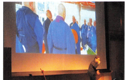
<感動のライブステージ>