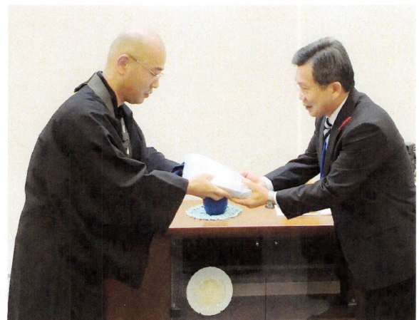
<江刺社会福祉協議会へ 浄財 (53,609 円) を寄付>