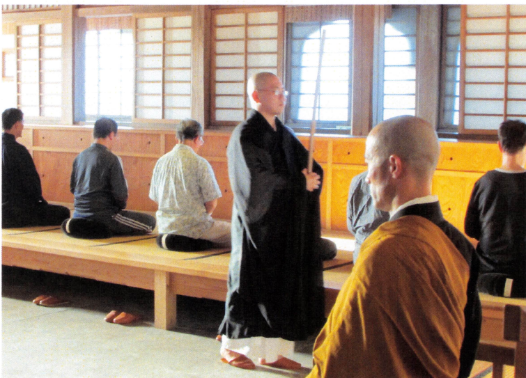
<調身、調息、調心 自己と向き合う>

二日目の七月十一日は午前四時半振鈴。暁天坐禅に続き朝課諷経。参禅者の皆様も一緒に般若心経を讀経して頂きました。午前六時四十分には小食。飯台終了と同時に普請鼓を合図に作務を開始。小休止の後、午前八時より二日間の緑蔭禅では最後の坐