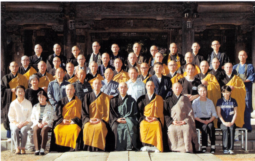
<報恩寺山門前にて 参禅者随喜衆と共に>

平成二十七年七月十日(金)～十一日(土)盛岡市は報恩寺様を会場に第五十回目となるみちのく緑蔭禅のつどいが開催されました。記念となる第五十回目のみちのく緑蔭禅のつどい。お陰様で本年もたくさんさんの御随喜御支援を賜り無事に修行することが出来ましたこと厚く御礼申し上げます。